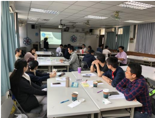
講師講解 108 學年素養導向