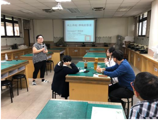
講師講解禪繞紆壓畫