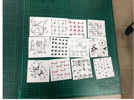
夥伴們研習的成果