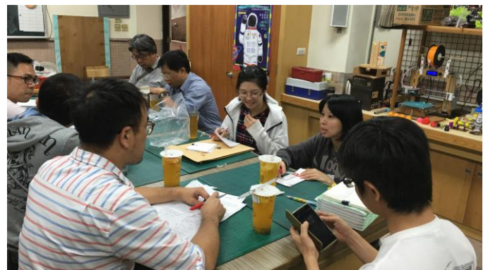
夥伴討論試題疑義