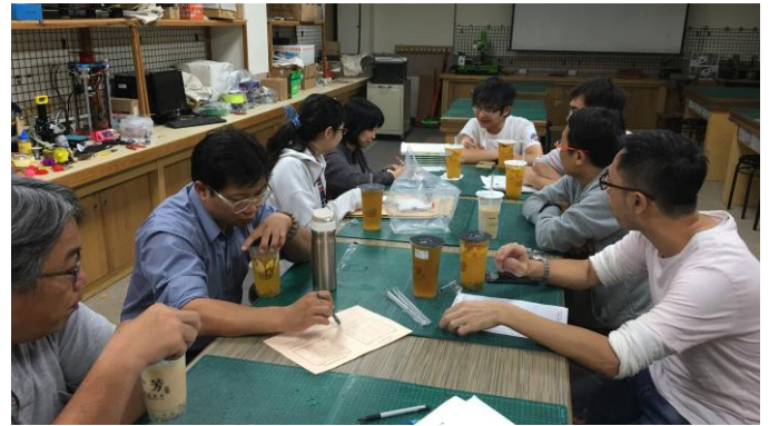
夥伴討論試題疑義