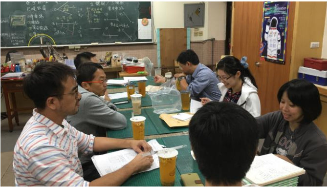
國七生物試題分析