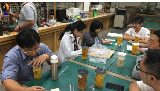
國九理化試題分析