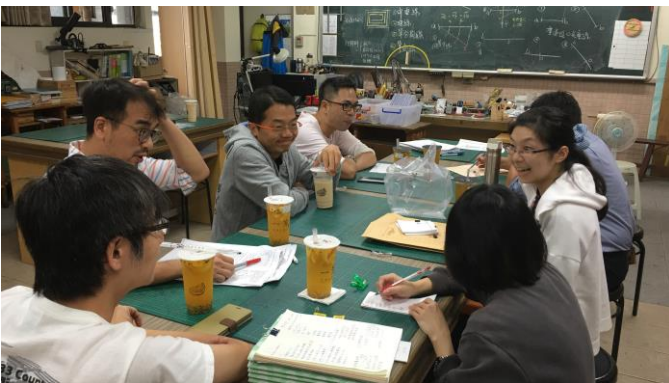
國八理化試題分析