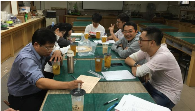
國九地科試題疑義