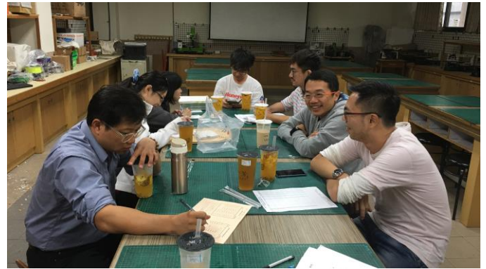
夥伴提出相關建議