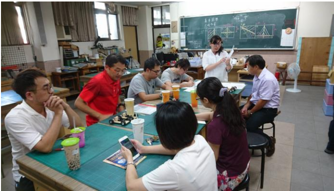
討論個案判別和通報流程