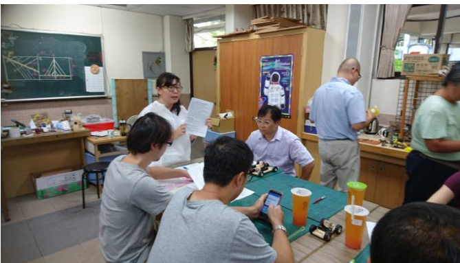
主講人詳述通報流程