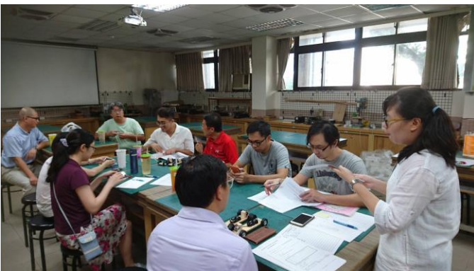
成員討論分享經驗