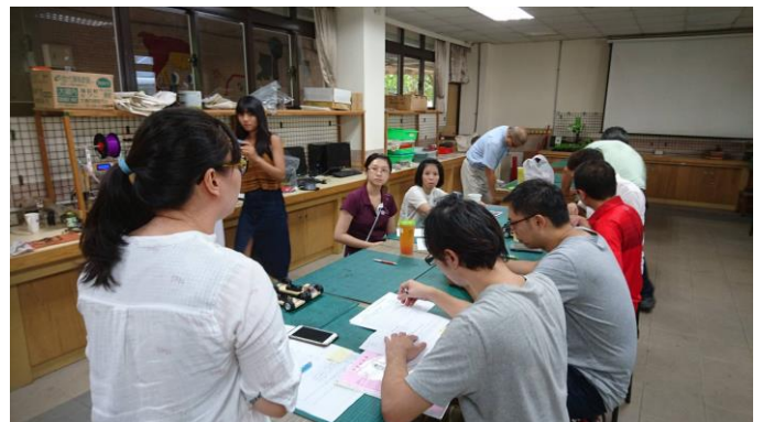
成員討論個案案例