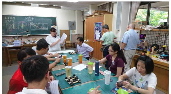
夥伴提出建議討論