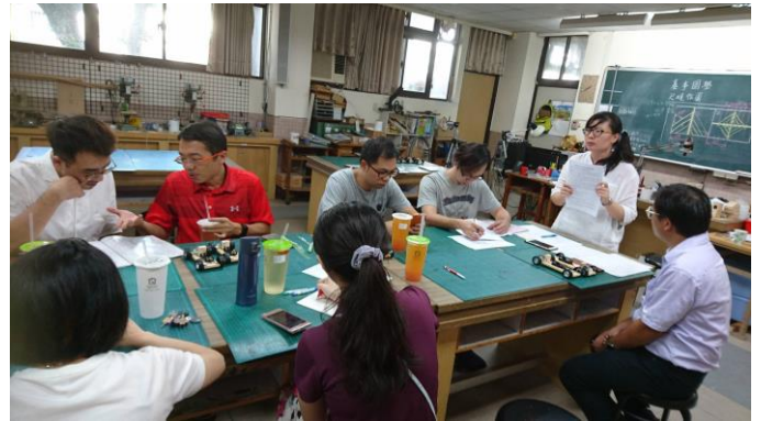
主講人提出高風險判別