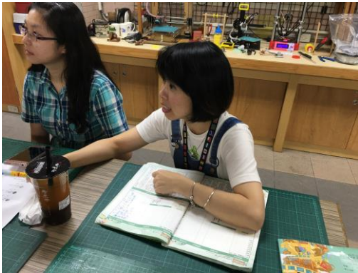
討論 106 年教育會考學生成績