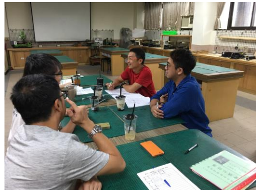
討論各科補救教學