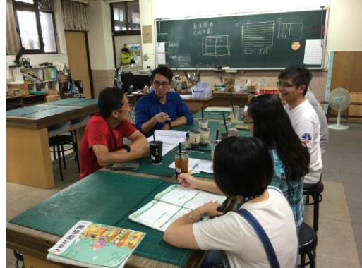
討論確定各科第一次段考範圍