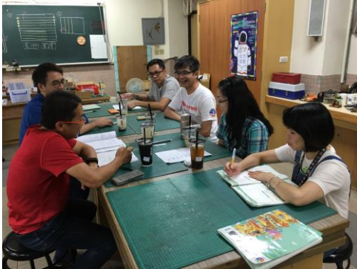
確認大同區自然群組研習時間