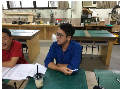
夥伴提出相關建議