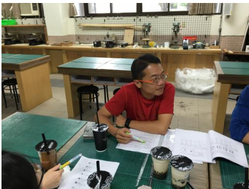
討論補救教學方式